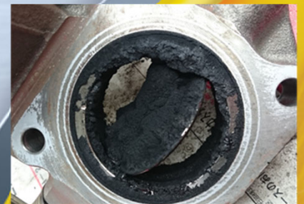
約28万km走行車のEGRバルブ