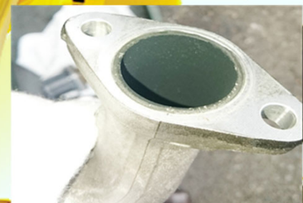
約23万km走行車のEGRバルブ