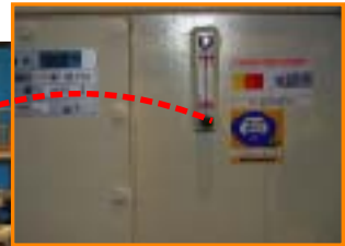
■産業用機械のオイル管理に