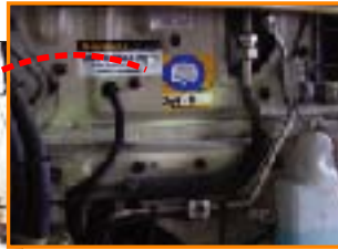
■車両のオイル管理に